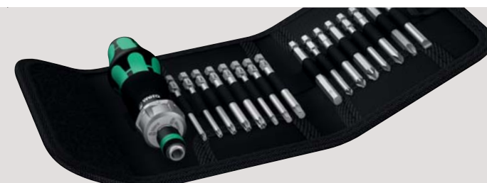
Kraftform Kompakt Vario RA