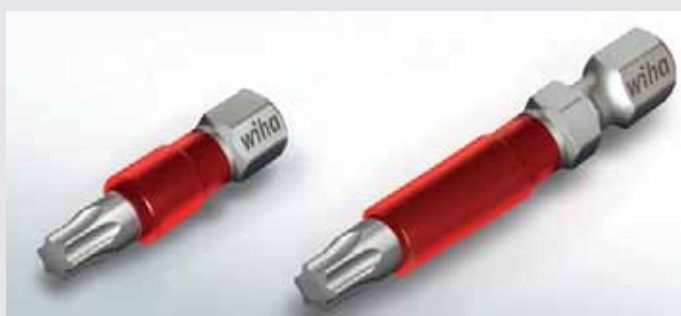
Биты MaxxTor 29 Непревзойденный бит Torsion

Мощные дрель-винтоверты и импульсные винтоверты предъявляют высокие требования к битам - например, по причине измененных характеристик нагружения в случае винтовертов Impact или особенно тяжелого вкручивания. В данном случае биты Standard быстро окажутся бессильны. Но не биты MaxxTor! Благодаря их оптимальной зоне скручивания срок службы битов значительно увеличивается.